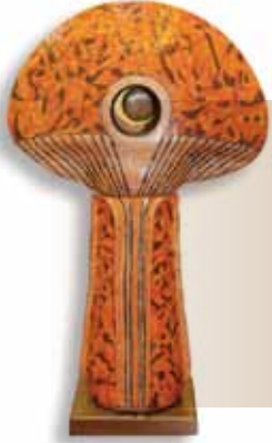
المركز الأول: سالم أحمد صالح جوهر