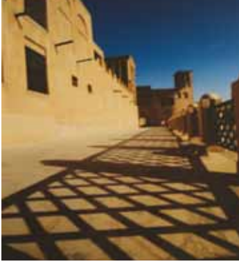
المركز الأول: نورة هارون أبو الشوارب