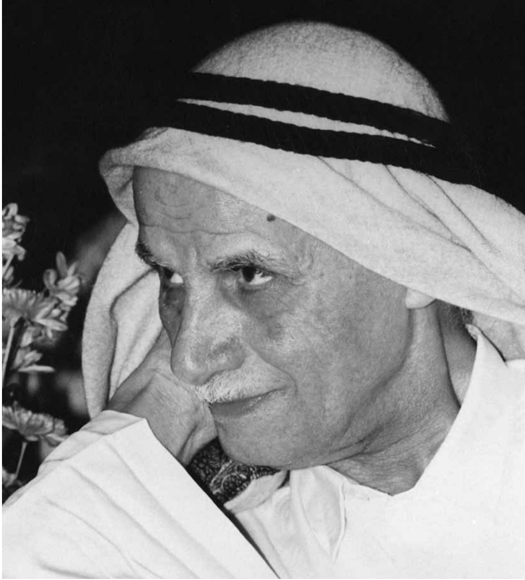
المرحوم سلطان بن علي العويس