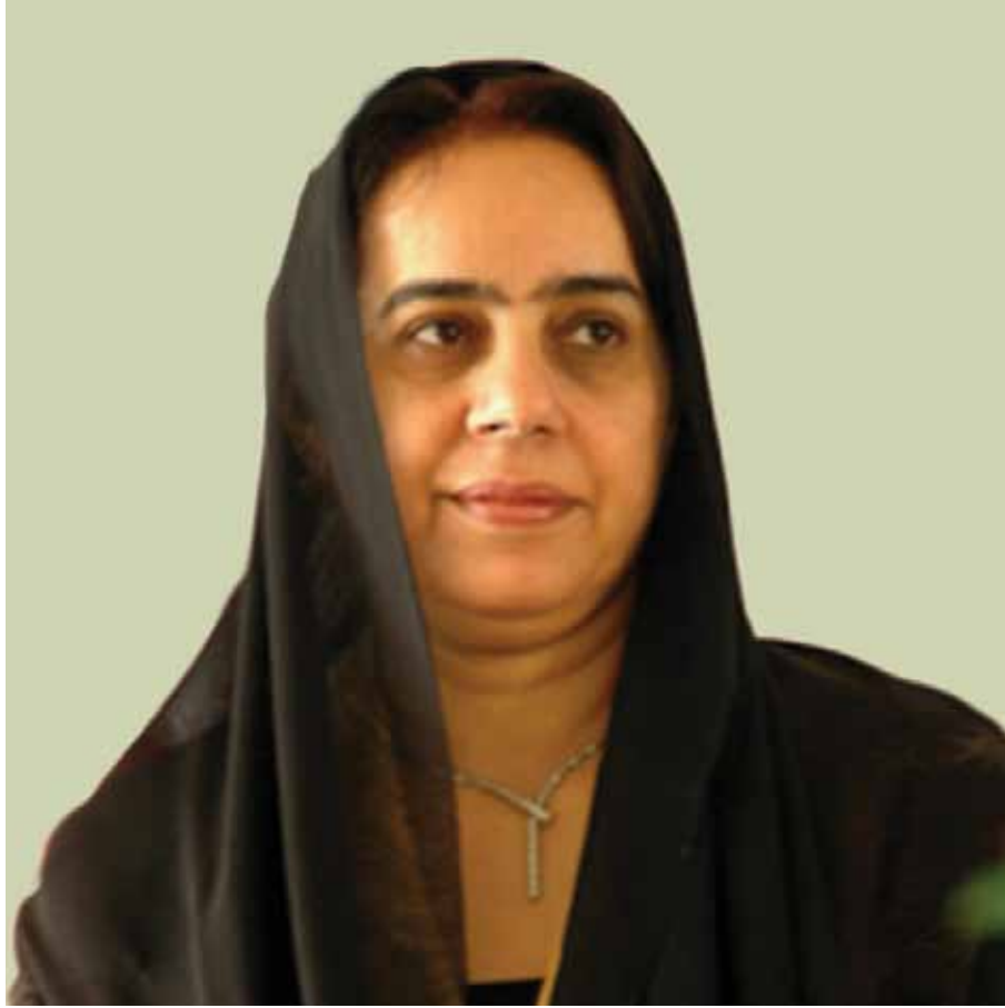
الدكتورة ربيعة عبيد غباش